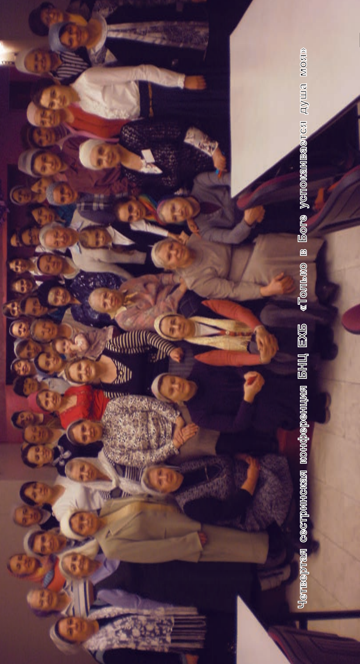
Четвертая сестринская конференция БНЦ ЕХБ «Только в Боге успокаивается душа моя»