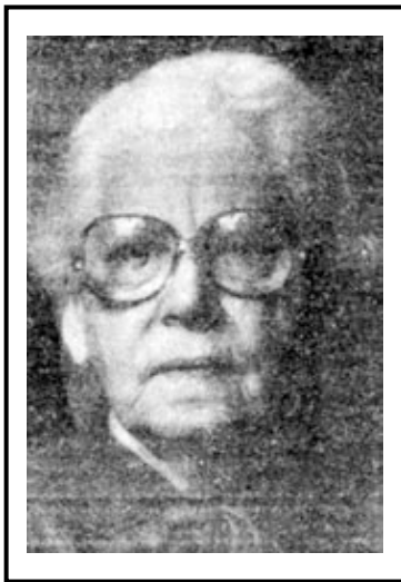
Л. М. ВИНС 1907—1985

В послевоенные годы Л. М. Винс переселилась с сыном Георгием в Киев. Там и застала