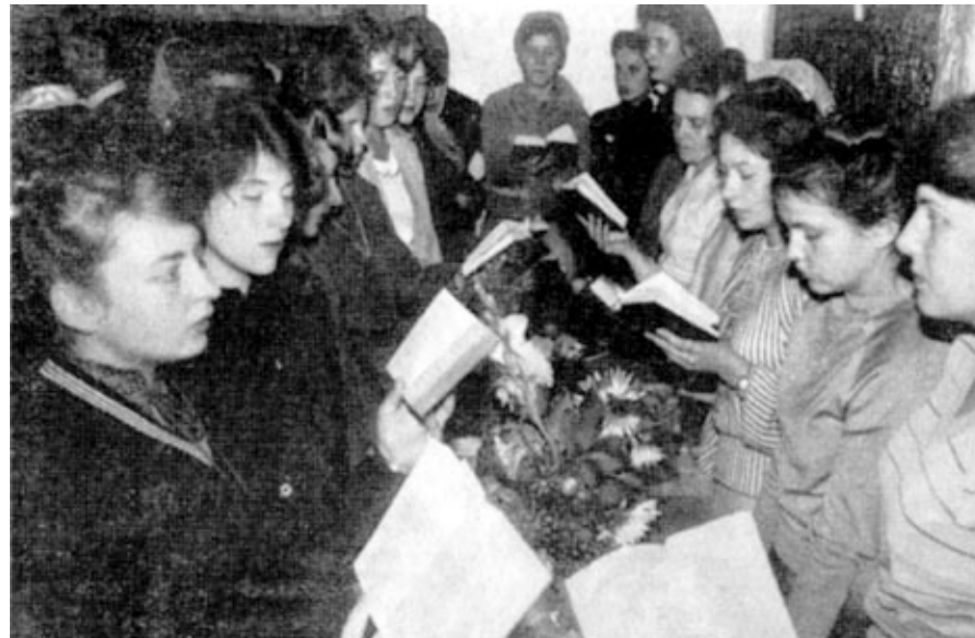
РАЗДЕЛИТЬ РАДОСТЬ РЫБИНСКОЙ ЦЕРКВИ В ДЕНЬ ЖАТВЫ — ПРИЕХАЛА МОЛОДЕЖЬ ИЗ ДРУГИХ ЦЕРКВЕЙ Очевидно обилие духовной литературы — этой благословенной жатвы печатного слова, дарованной Господом Своему народу

Еще не поздно молиться такой молитвой. Господь может и хочет сделать и из вас тружеников Своих. Он говорит: "Искал Я у них человека, который поставил бы стену и стал бы предо Мною в проломе за сию землю..." (Иез. 22, 30). Люди вздыхают от страха будущих бедствий. Кто скажет им о спасении?! Мы должны быть носителями Его обоюдоострого меча! Мы должны стать раздавателями Его святого Хлеба!