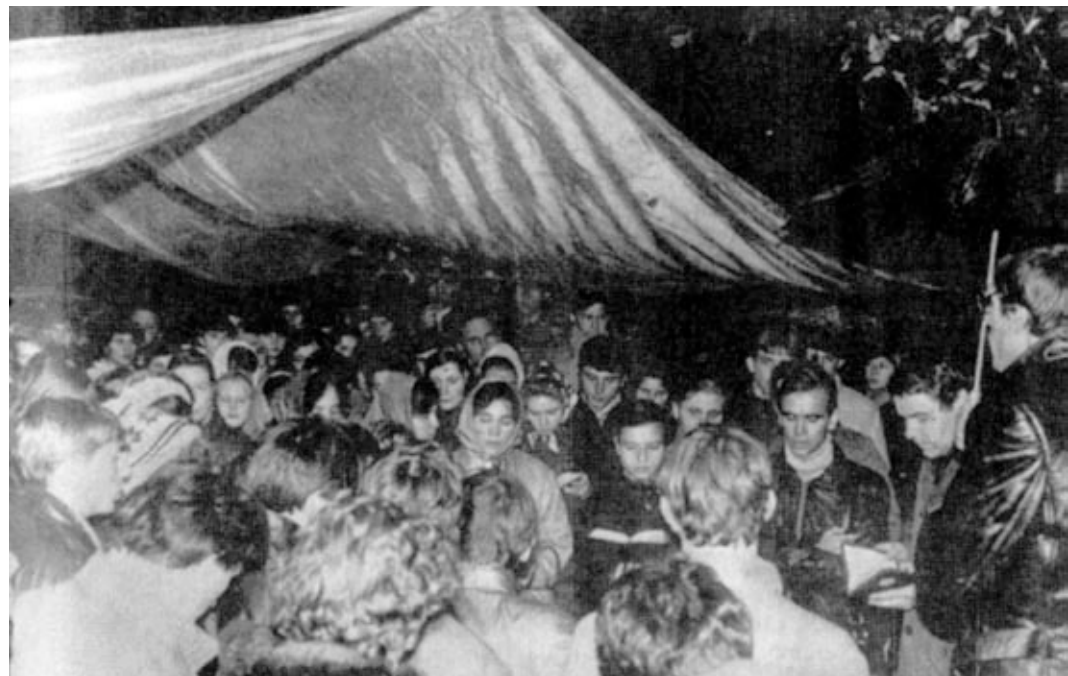
г. Киев. 7 октября 1986 г. Общение, посвященное 110-летию перевода Библии на русский язык.

— Очень хочу иметь ее рядом каждую минуту. Но, благодарение Богу, она почти вся жива в моей памяти. Каждый день мысленно я прочитываю по главе и в течение