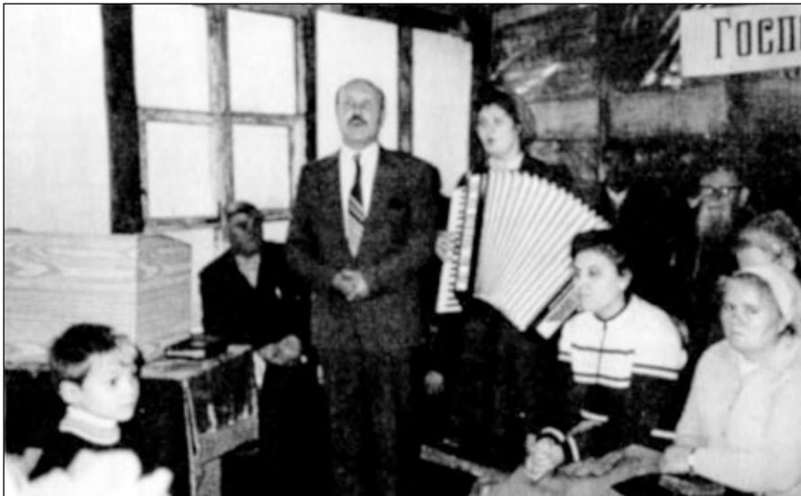
„...Я ПРОСЛАВЛЮ ЕГО ПЕСНЮ МОЕЮ" (Пс. 27, 7).

ОБ ЭТОМ МОЛИЛИСЬ, ЗА ЭТО СТРАДАЛИ МНОГИЕ ВЕРНЫЕ ДЕТИ БОЖЬИ. Общение христианской молодежи Центра России. Май 1988 г.