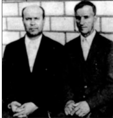
Редкие встречи в перерывах между узами за имя Господа.

Возвращаясь из поездки по Северному Кавказу, я не рассчитал время и засветло подъехал к дому, в котором работал. Он находился под постоянным