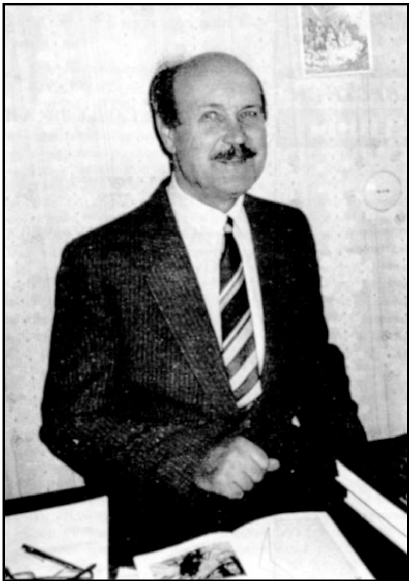
Николай Георгиевич БАТУРИН (1927—1988)