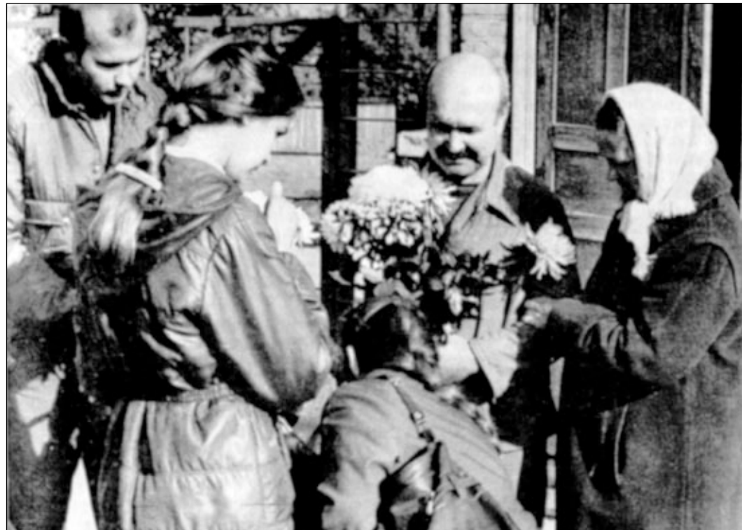
Сентябрь 1986 года. Трогательная встреча с родными у ворот лагерной зоны после 6-х уз за имя Господа.

Семь дней везли до Ростова. Там я пробыл последнюю неделю перед освобождением. 26 сентября доставили в Шахты. Ночь провел в бараке. Утром объявили надзор: с шести вечера до шести утра из дому не выходить, раз в неделю отмечаться в милиции и за пределы города не выезжать. И меня освободили.