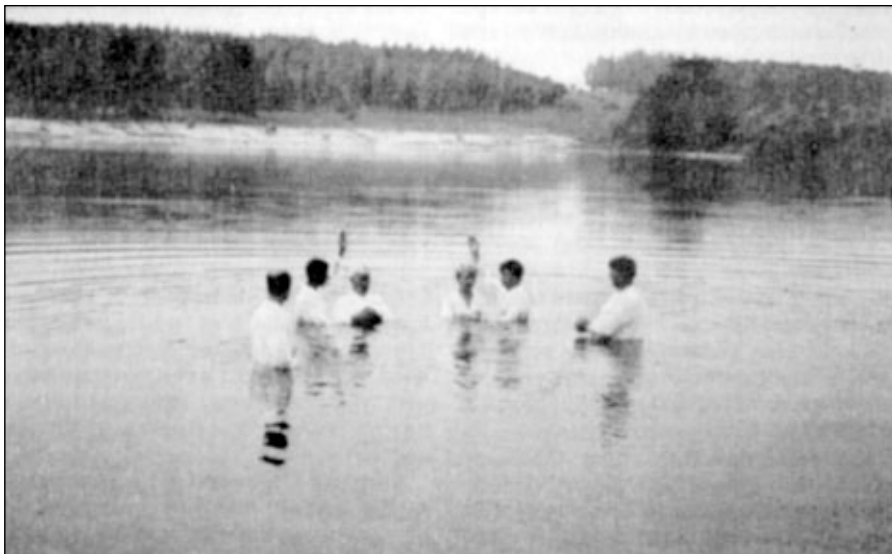
МНОГО ПЕРЕНЕСШАЯ ШАХТИНСКАЯ ЦЕРКОВЬ УМНОЖАЕТСЯ ЧИСЛОМ.