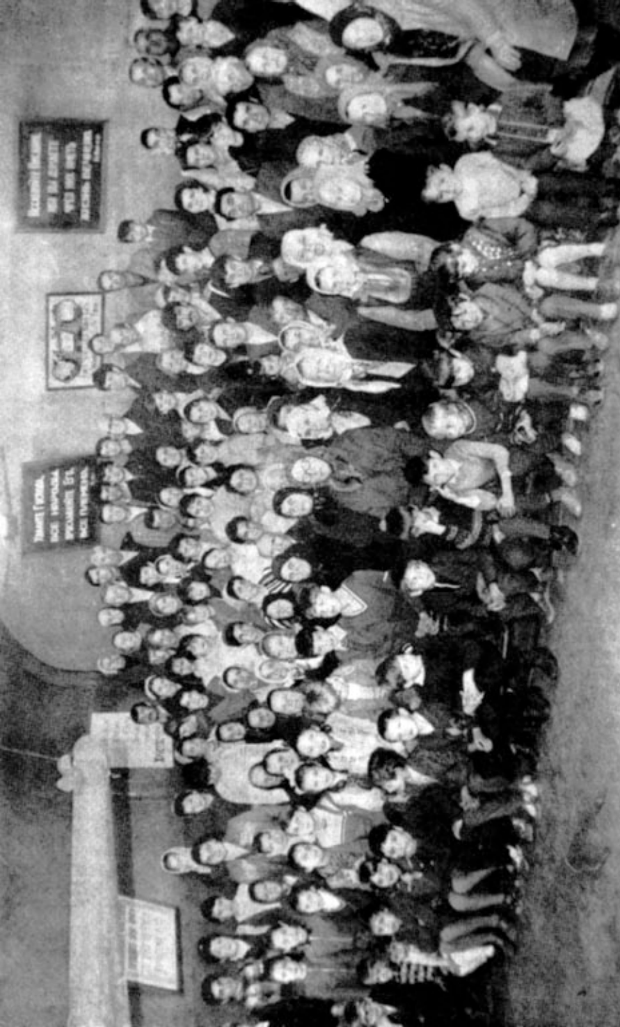
Радость наполнила каждую семью, каждую душу после того, как церковь г. Измаила (Одесской обл.) сдала автономную регистрацию и прошла очищение и освящение.

настаивал на регистрации нашей общины, не скрывая при этом требования исполнять существующее законодательство о культурах. Предлагал написать заявление об отречении от Совета церковей и дал три месяца на размышление. Внутреннее состояние церкви было тяжелым. "Если между вами... споры и разногласия, то не плотские ли вы?.." (1 Кор. 3, 3), — писал Апостол Павел. То же происходило и с нами. Не было желания идти узким путем.