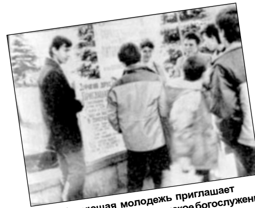
Верующая молодежь приглашает жителей города на христианское богослужение (г. Кишинев).

Благодарение Богу за Его великую благодать! В радостное общение со Христом в эти дни влилось более 150 человек. Новообращенным коротко преподали основные истины евангельского учения; иногородних просили по возвращении домой сообщить в своих церквях о своем покаянии. Благословив именем Господа покаявшихся, предали их благодати Божьей.