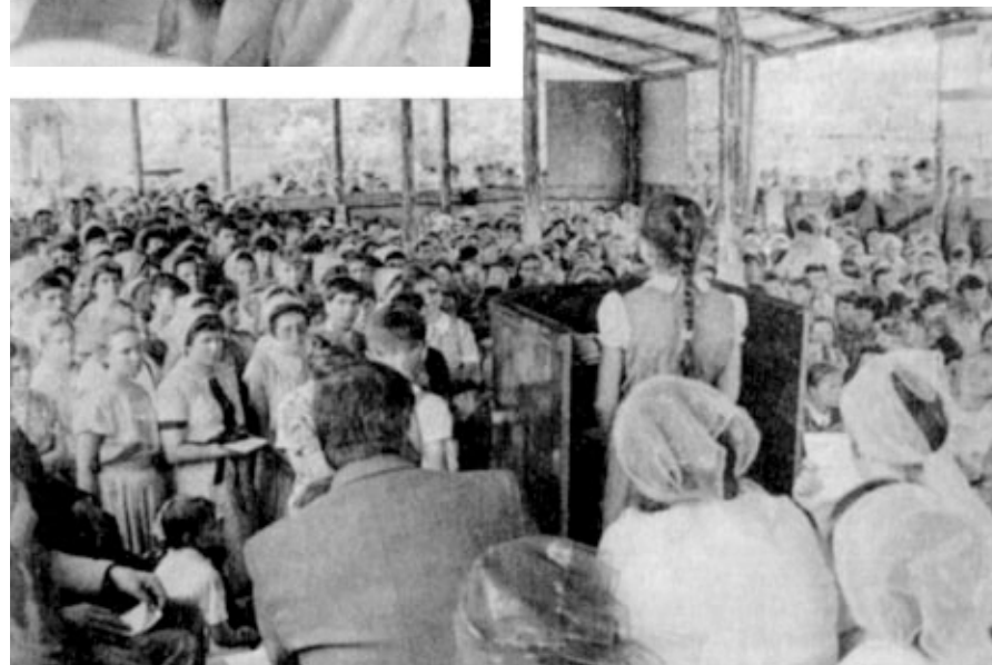
"СПАСЕНИЕ БОЖИЕ ПОСЛАНО ЯЗЫЧНИКАМ; ОНИ И УСЛЫШАТ" (Д. Ап. 28, 28). Особую благодать Господа ощутили присутствующие на евангелизационном богослужении в Дедовске (Московская обл.).

"Где двое или трое собраны во имя Мое, там Я посреди них", — сказал Христос (Мтф. 18, 20). Все ли знают, что на этом месте, где мы сейчас находимся, присутствует Господь? Может быть, кто-то скажет, как некогда Иаков: "Истинно Господь присутствует на месте сем; а я не знал!" (Быт. 28, 16—17).