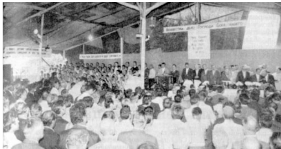
ВСЕСОЮЗНОЕ СОВЕЩАНИЕ СЛУЖИТЕЛЕЙ ОБЩИН СЦ ЕХБ г. Ростов-на-Дону, 1—2 июля 1989 г.

И вот такими, возжаждавшими общения друг с другом пред лицом Божиим, Он и собрал нас на эту радостную встречу, обеспечив Своей благословенной защитой, Своим личным присутствием. Поэтому мы и пережили в эти волнующие дни