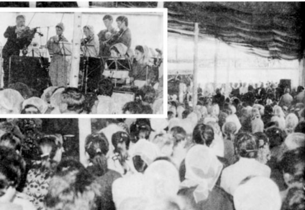
«ПРИДИТЕ КО МНЕ, ВСЕ ТРУЖДАЮЩИЕСЯ И ОБРЕМЕНЕННЫЕ, И Я УСПОКОЮ ВАС Этот призыв Христа звучит и в наши дни для всех измученных грехом. (Призывное общение в г. Туле. Август 1989 г.)

Давно уже Тульская церковь не переживала таких благословений. Дети Божьи заметно ободрились, воспрянули духом, их служение наполнилось новым содержанием — жадной и дальше свидетельствовать погибающим о спасении во Христе.