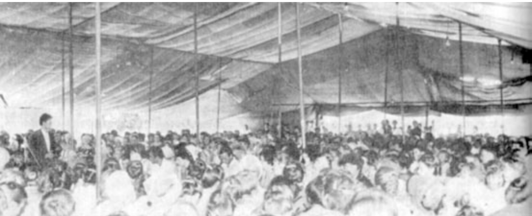
"ВСЕ СОБРАНИЕ МОЛИЛОСЬ, И ПЕВЦЫ ПЕЛИ, И ТРУБИЛИ ТРУБЫ..." (2 Пар. 29, 28).

"За самовольное проведение собрания" хозяев оштрафовали на 50 рублей. Есть еще зло в этом мире, есть люди, противящиеся истине. Да спасет их Господь по милости Своей.